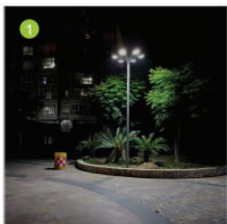
Après 25 secondes (Puissance 25%)