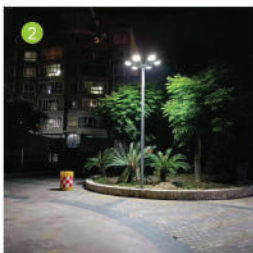
Quand quelqu'un passe (Puissance 100%)